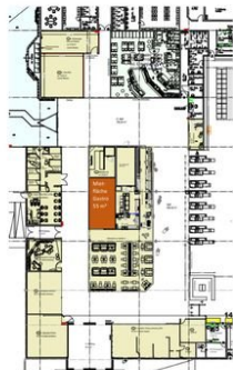
Gesamtausschnitt Mall m. Mietfläche 55 m 2 -001.jpg